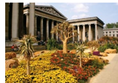
Anglie - Londýn - Britské muzeum