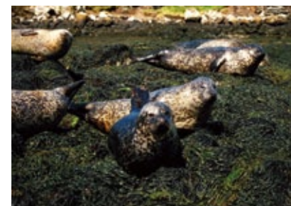
Skotsko - Skye - Dunvegan