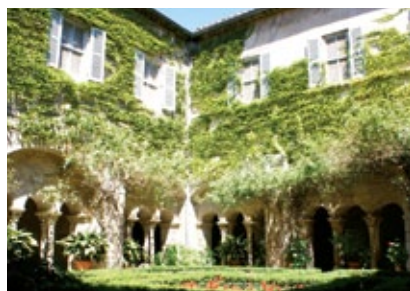
Francie - Provence