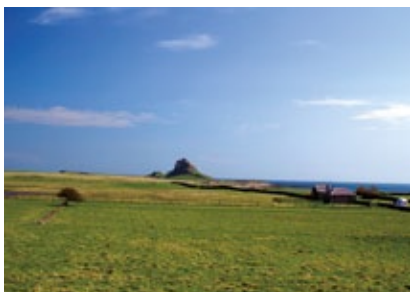
Sev. Anglie - Holy Island