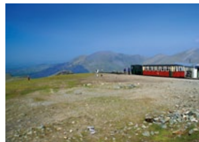
Wales - Snowdon