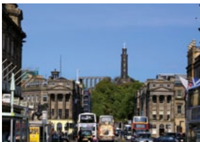
Skotsko - Edinburgh