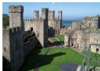
Anglie - Warwick Castle