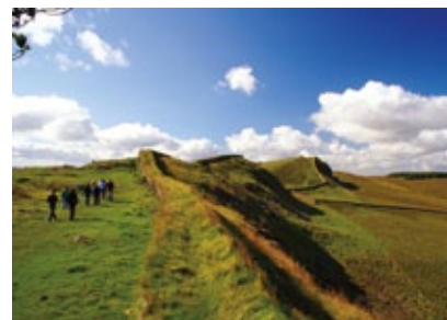
Sev. Anglie - Hadriánův Val