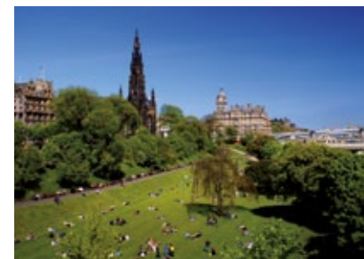
Skotsko - Edinburgh