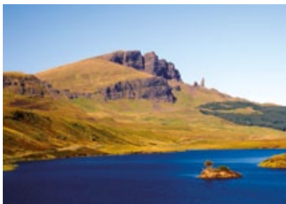
Skotsko - ostrov Skye