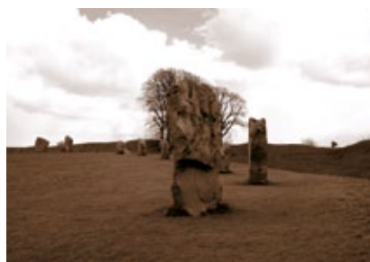
Anglie - Avebury