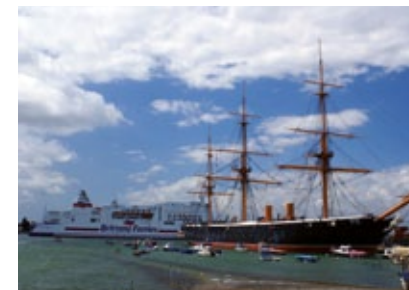
Anglie - Portsmouth