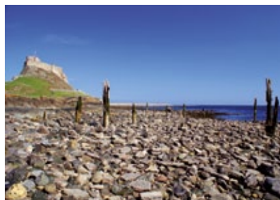
Sev. Anglie - Holy Island