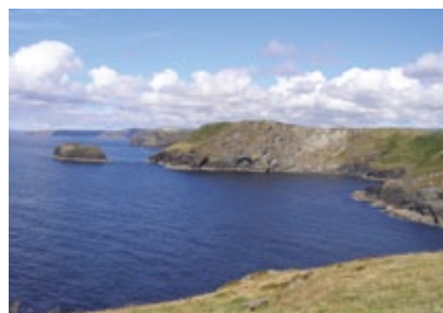
Anglie - Cornwall