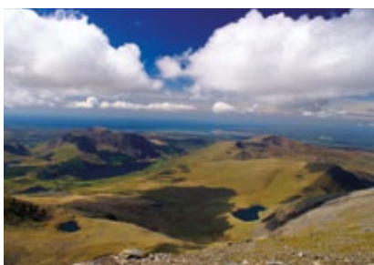
Wales - Snowdon