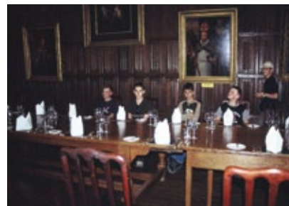
Anglie - Oxford (Harry Potter)