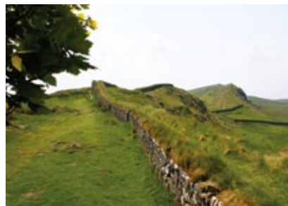
Skotsko / Anglie - Hadriánův val