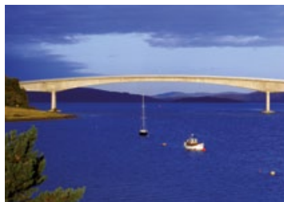
Skotsko - Skye