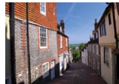
Anglie - Lewes