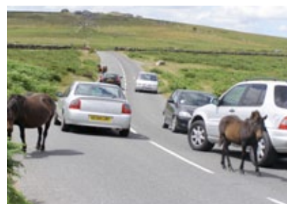
Anglie - Devon - Dartmoor