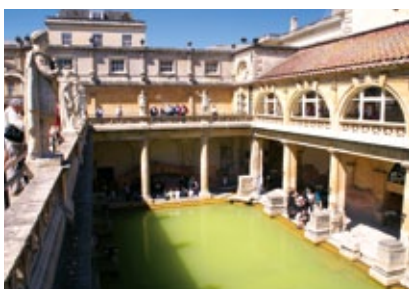
Anglie - Bath