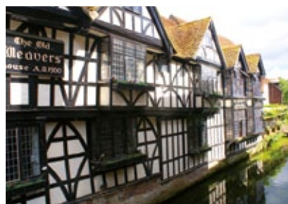
Anglie - Canterbury