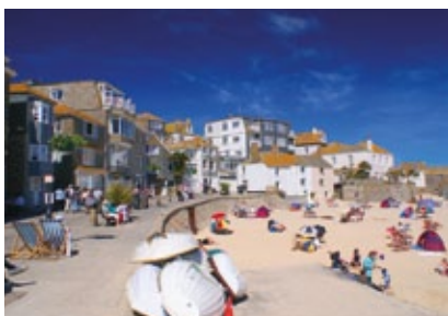
Anglie - Cornwall - St. Ives