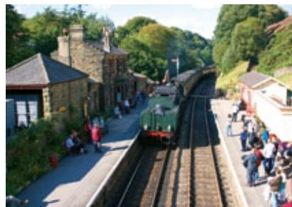
Anglie - Goathland (Harry Potter)