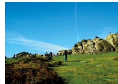
Anglie - Devon - Dartmoor