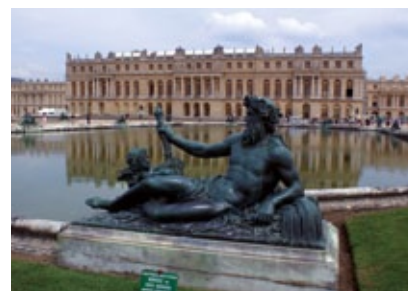
Francie - Versailles