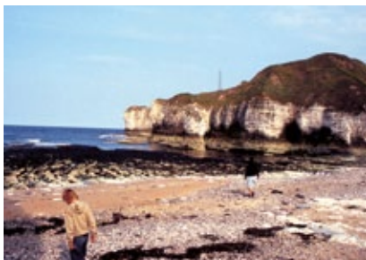
Anglie - Flamborough Head