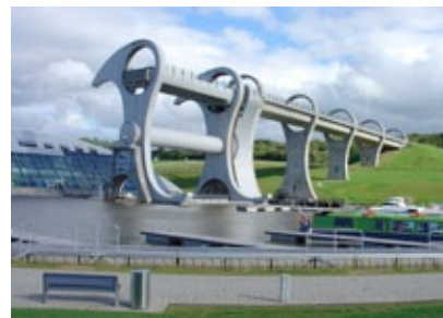
Skotsko - Falkirk Wheel