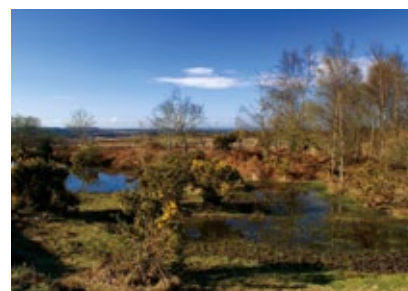
Anglie - New Forest