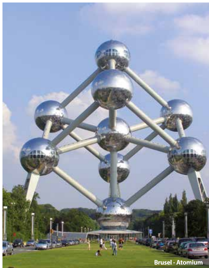
Brusel - Atomium

Nenašli jste, co jste hledali? Nevadí, uděláme Vám program na míru.