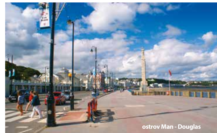
ostrov Man - Douglas