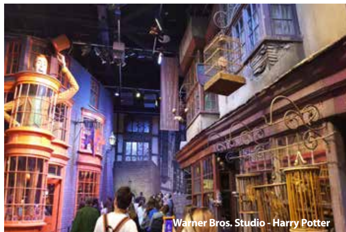
Warner Bros. Studio - Harry Potter

Cena kurzu je kalkulována pro 45 osob + 2x pedagogický dozor. Sleva 50 Kč až 300 Kč / osoba, viz katalog strana 52.