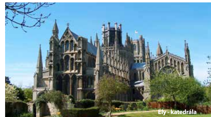
Ely - katedrála