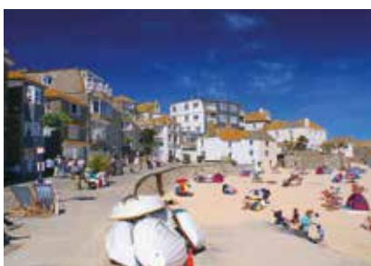
Anglie - Cornwall - St. Ives