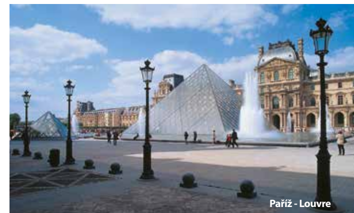
Paříž - Louvre