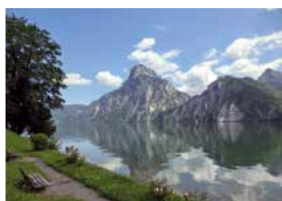
Rakousko - Traunsee