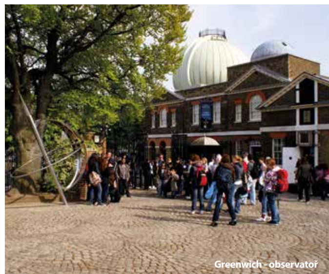
Greenwich - observatoř