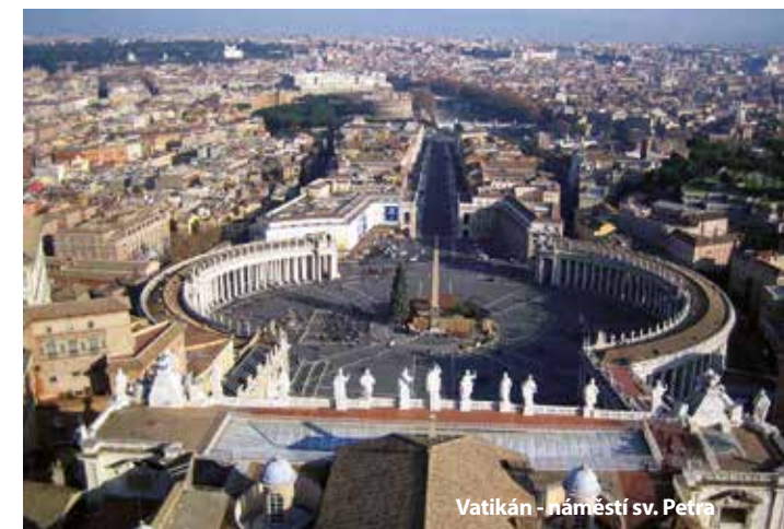
Vatikán - náměstí sv. Petra

Cena zájezdu je kalkulovaná pro 45 osob + 2x pedagogický dozor. Sleva 50 Kč až 300 Kč / osoba, viz katalog strana 52.