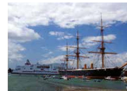
Anglie - Portsmouth