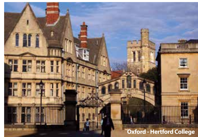
Oxford - Hertford College