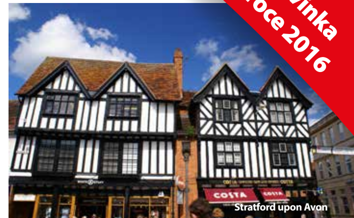
Stratford upon Avon