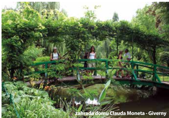
zahrada domu Clauda Moneta - Giverny