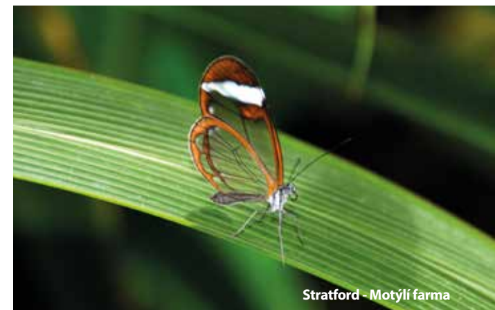
Stratford - Motýlí farma