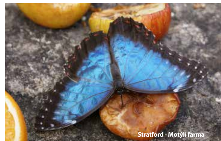
Stratford - Motýlí farma