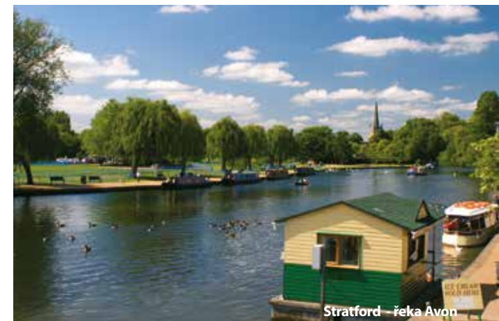
Stratford - řeka Avon