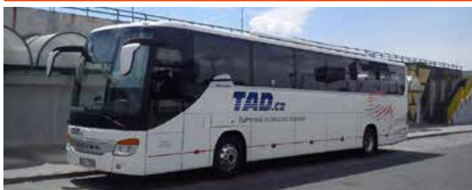
Setra 53 míst, rok výroby 2011