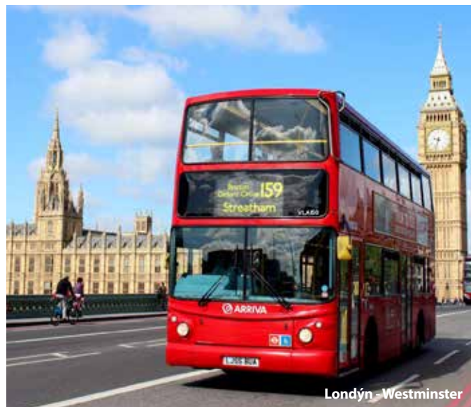
Londýn - Westminster

Cena zájezdu je kalkulovaná pro 45 osob + 2x pedagogický dozor. Sleva 50 Kč až 300 Kč / osoba, viz katalog strana 52.