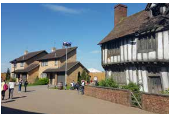
Filmové ateliéry Londýn - Warner Bros. Studio