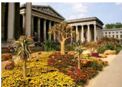
Anglie - Londýn - Britské muzeum