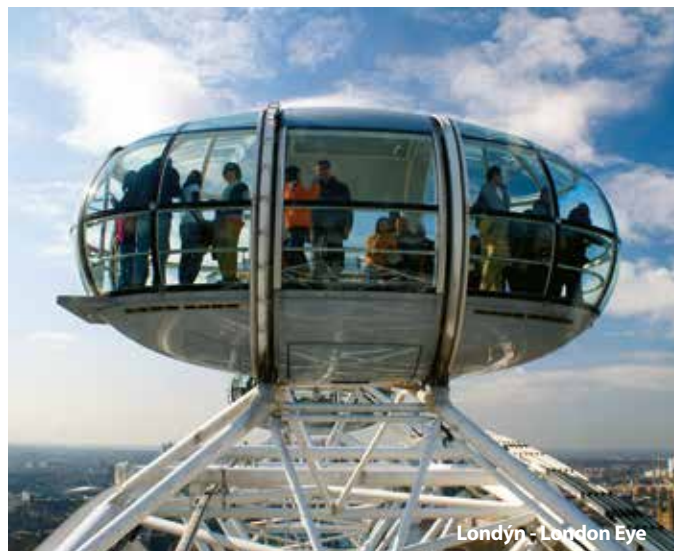
Londýn - London Eye

Chcete poznat krásy ostrova Isle of Wight? Zavolejte nám.