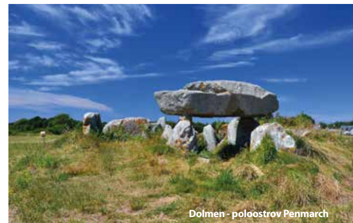
Dolmen - poloostrov Penmarch