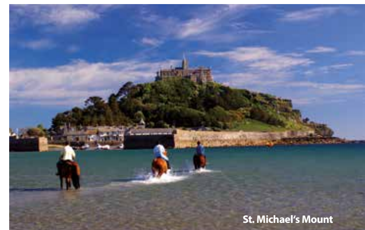
St. Michael's Mount