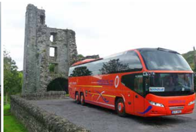
Neoplan Cityliner - 57 míst - rok výroby 2012