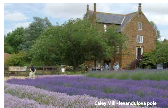
Caley Mill - levandulová pole