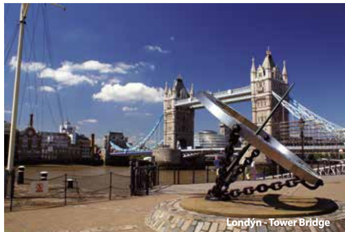
Londýn - Tower Bridge