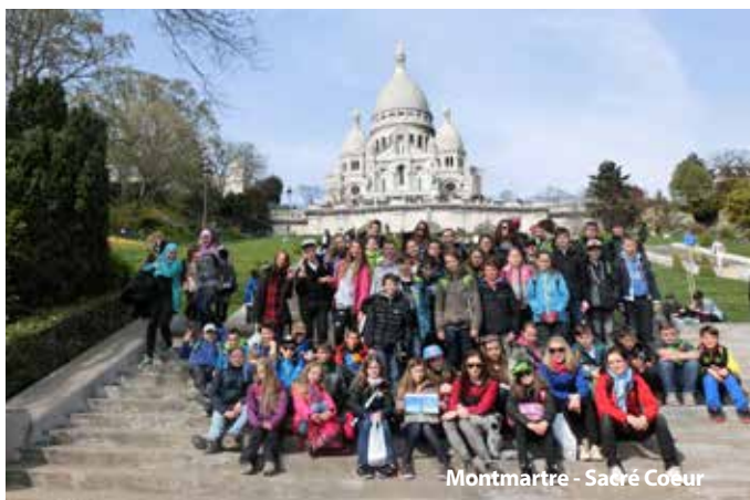
Montmartre - Sacré Coeur