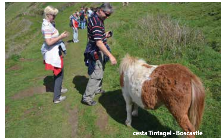
cesta Tintagel - Boscastle