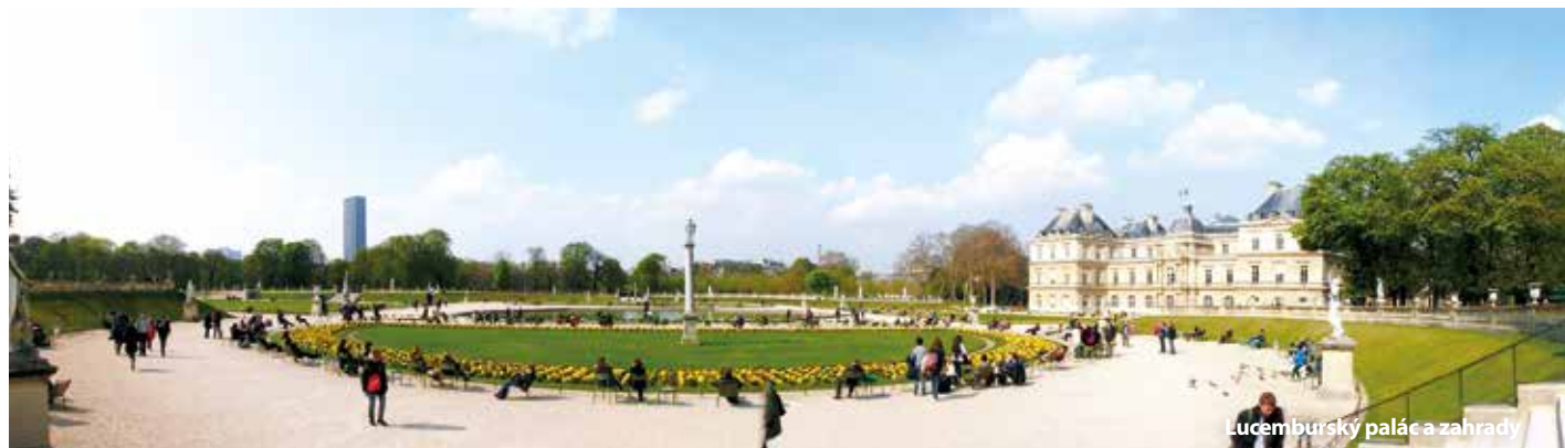
Lucemburský palác a zahrady

Získejte slevu až 300 Kč výběrem termínu od listopadu 2015 do března 2016