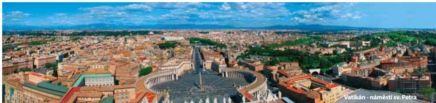
Vatikán - náměstí sv. Petra

5. den Příjezd do ČR v poledních hodinách.