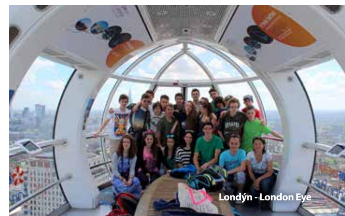
Londýn - London Eye