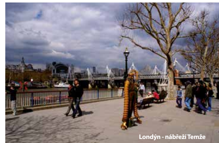
Londýn - nábřeží Temže