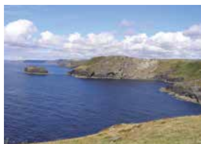
Anglie - Cornwall