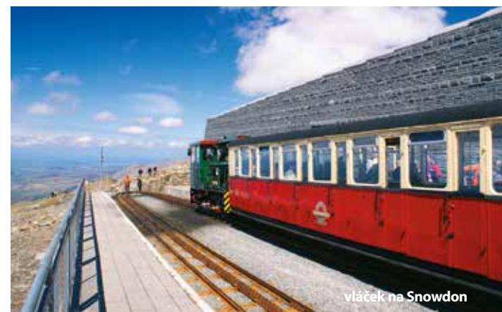
vláček na Snowdon