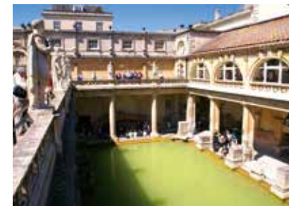
Anglie - Bath