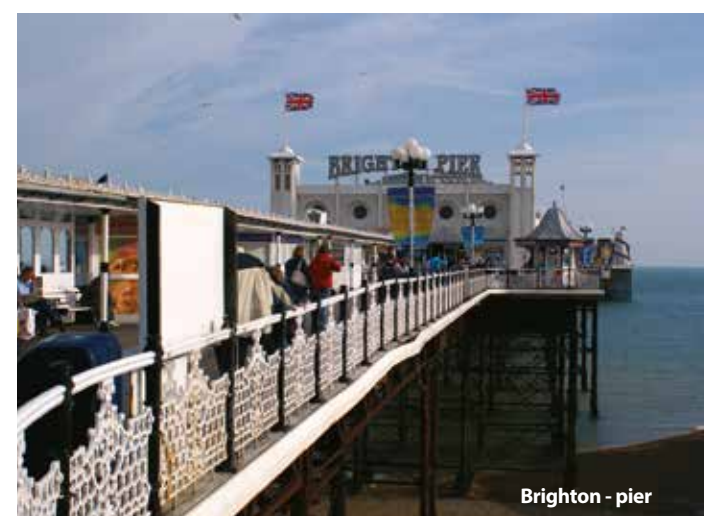
Brighton - pier