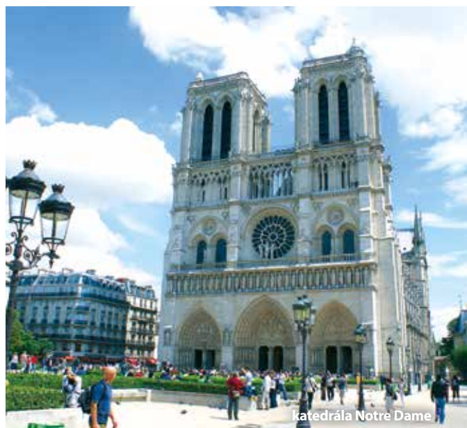
katedrála Notre Dame

Cena zájezdu je kalkulovaná pro 45 osob + 2x pedagogický dozor. Sleva 50 Kč až 300 Kč / osoba, viz katalog strana 52.