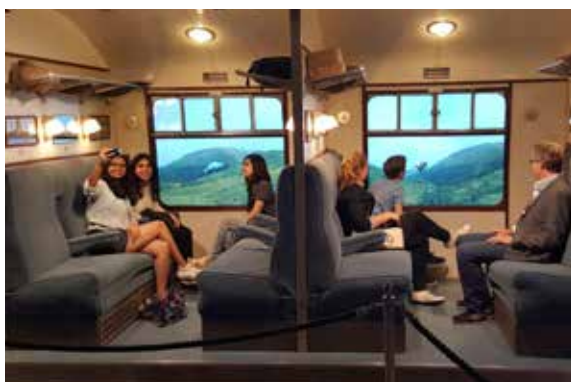
Filmové ateliéry Londýn - Warner Bros. Studio