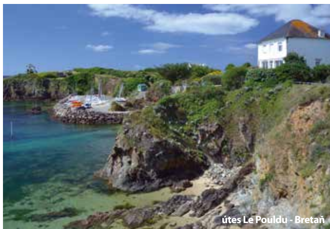
útes Le Pouldu - Bretaň