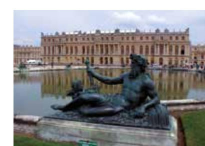
Francie - Versailles