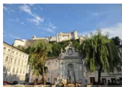
Rakousko - Salzburg