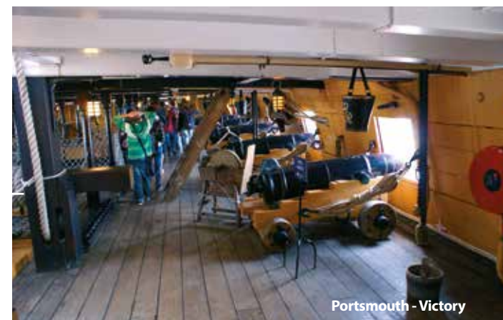
Portsmouth - Victory