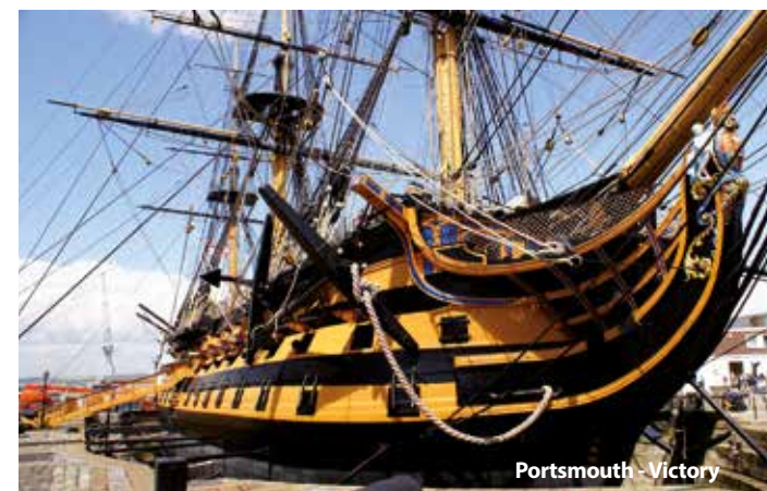
Portsmouth - Victory