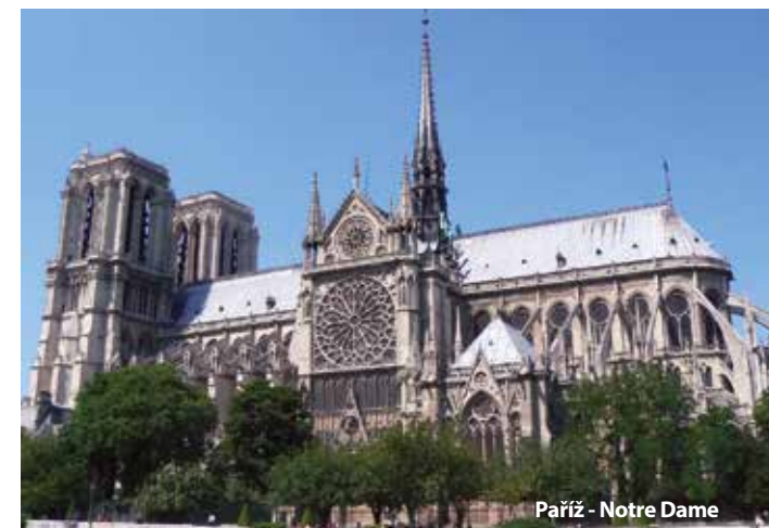
Paříž - Notre Dame