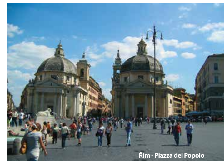
Řím - Piazza del Popolo