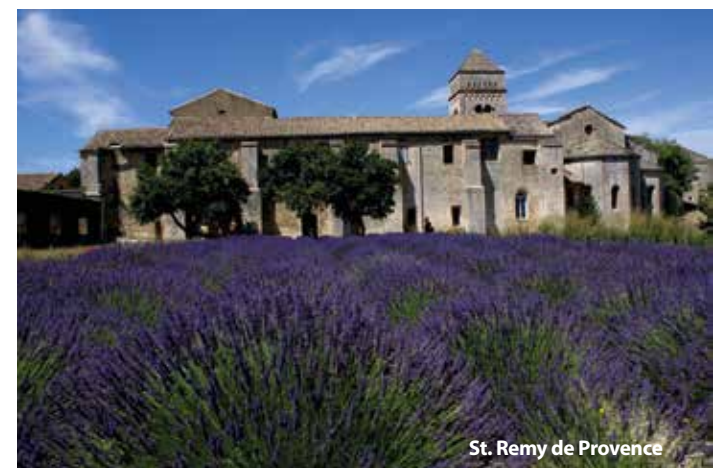
St. Remy de Provence