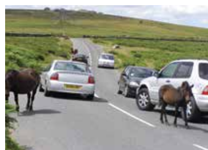
Anglie - Devon - Dartmoor