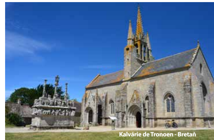
Kalvárie de Tronoen - Bretaň