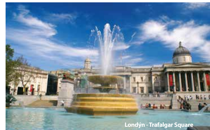
Londýn - Trafalgar Square