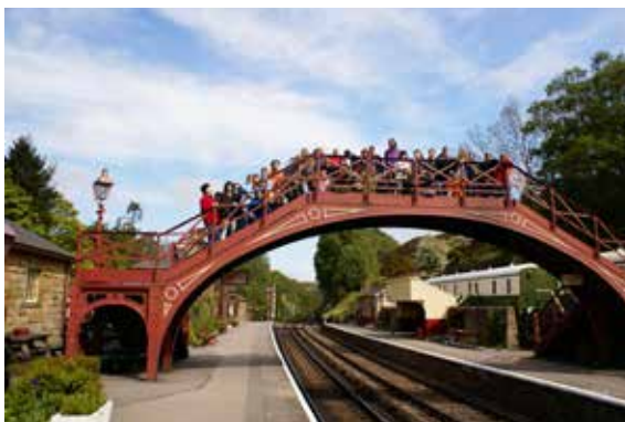
Nadraží v Bradavicích