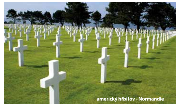
americký hřbitov - Normandie