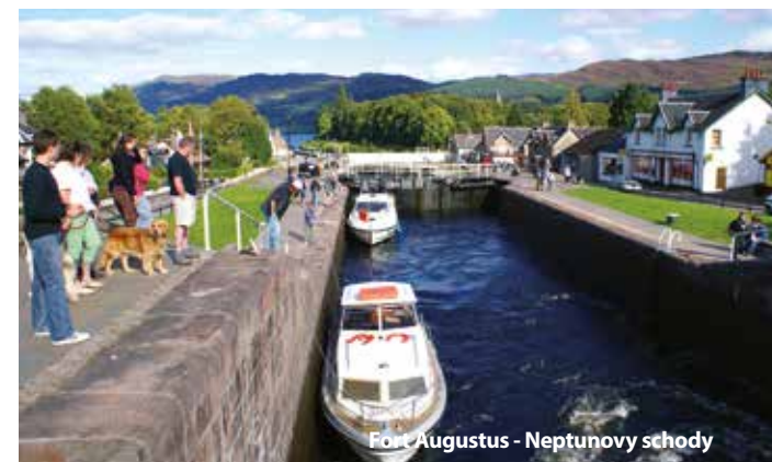
Fort Augustus - Neptunovy schody