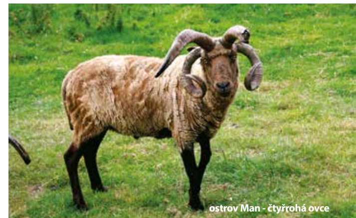
ostrov Man - čtyřrohá ovce