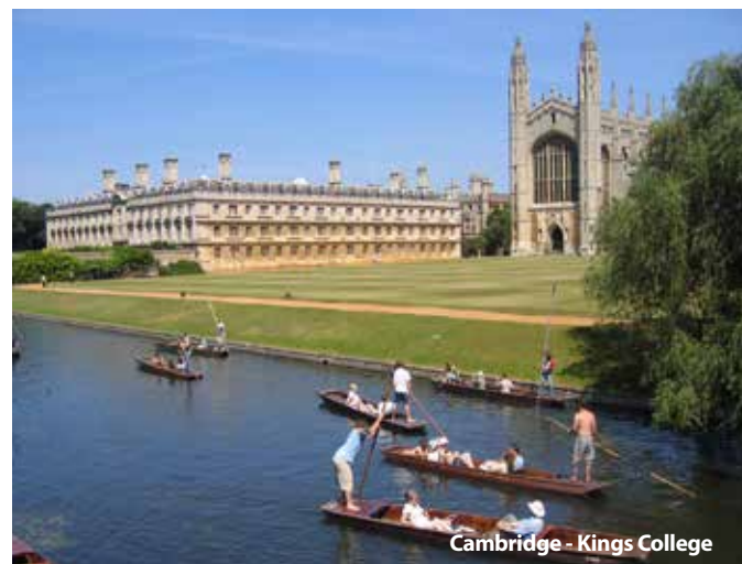
Cambridge - Kings College

Využíváme pouze bezpečné autobusy, viz strana 48.