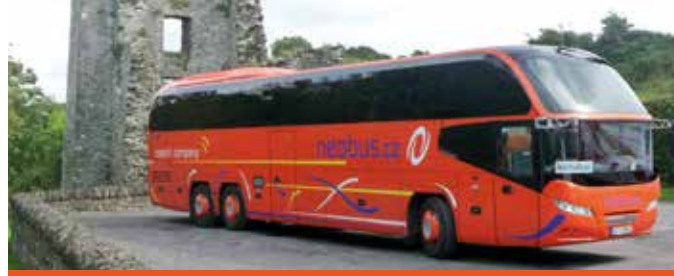
Neoplan 57 míst, rok výroby 2012