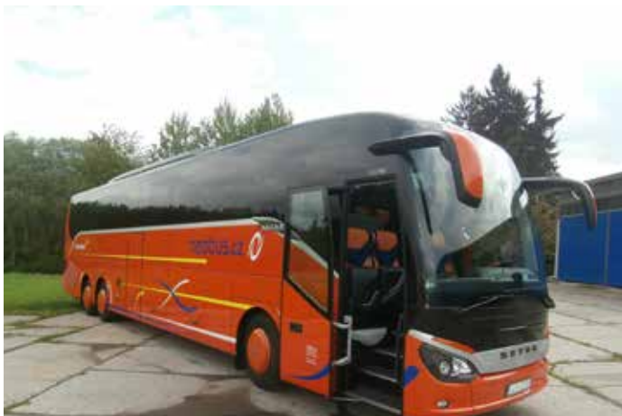
Setra 517 HD - 57 míst - rok výroby 2015