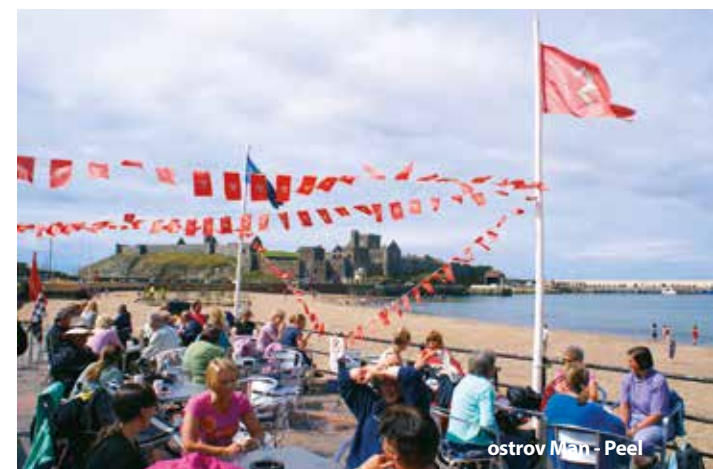
ostrov Man - Peel