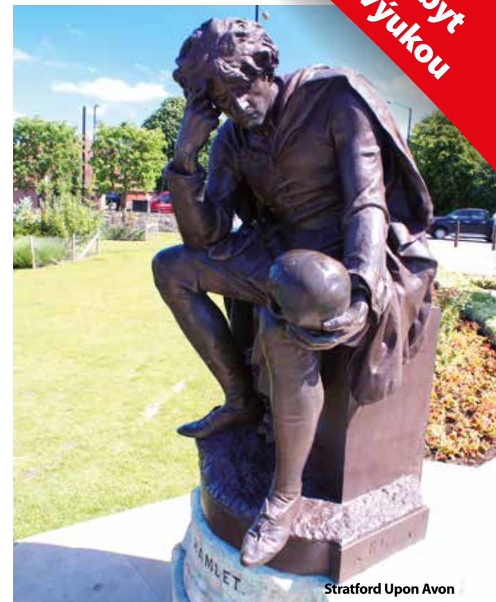
Stratford Upon Avon

Cena kurzu je kalkulována pro 45 osob + 2x pedagogický dozor. Sleva 50 Kč až 300 Kč / osoba, viz katalog strana 52.