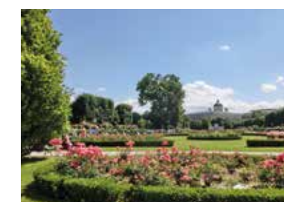
Rakousko - Vídeň