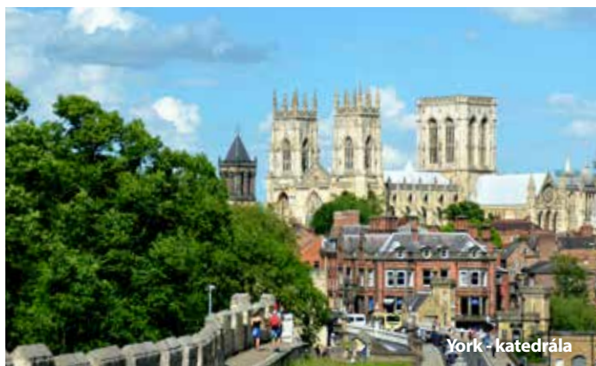
York - katedrála

8. den V odpoledních hodinách návrat do Prahy.