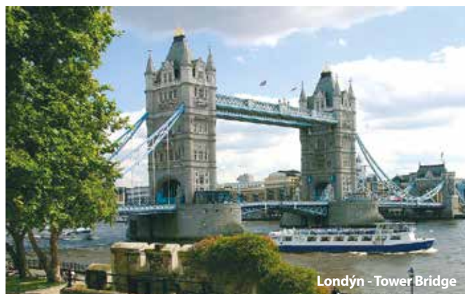
Londýn - Tower Bridge

Získejte slevu až 300 Kč výběrem termínu od listopadu 2015 do března 2016