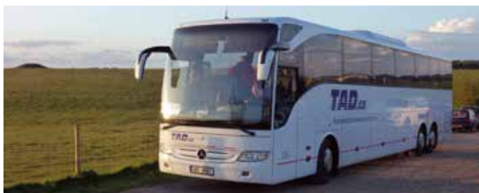
Mercedes 57 míst, rok výroby 2009