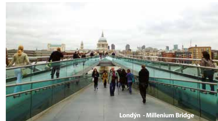
Londýn - Millenium Bridge