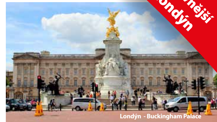
Londýn - Buckingham Palace