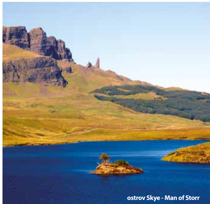
ostrov Skye - Man of Storr

Cena zájezdu je kalkulovaná pro 45 osob + 2x pedagogický dozor. Sleva 50 Kč až 300 Kč / osoba, viz katalog strana 52.