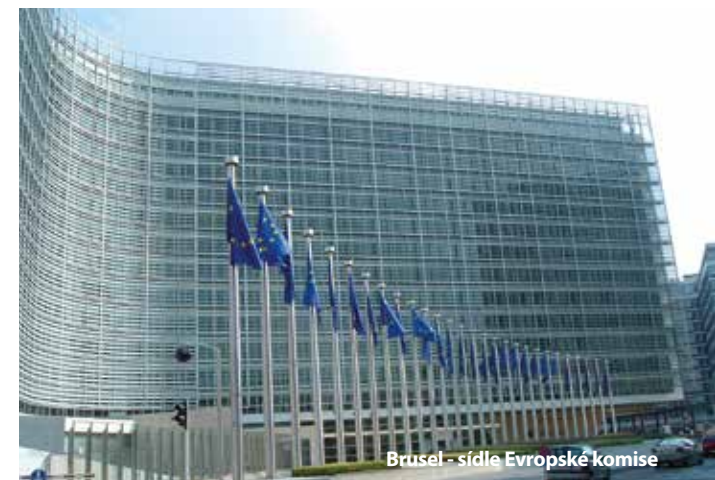
Brusel - sídlo Evropské komise