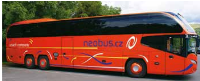
Neoplan 57 míst, rok výroby 2009