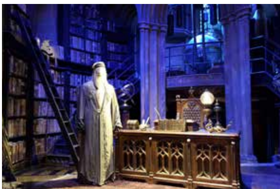
Filmové ateliéry Londýn - Warner Bros. Studio