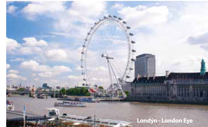
Londýn - London Eye

Cena zájezdu je kalkulovaná pro 45 osob + 2x pedagogický dozor. Sleva 50 Kč až 300 Kč / osoba, viz katalog strana 52.