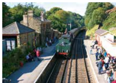
Anglie - Goathland (Harry Potter)