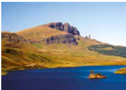
Skotsko - ostrov Skye