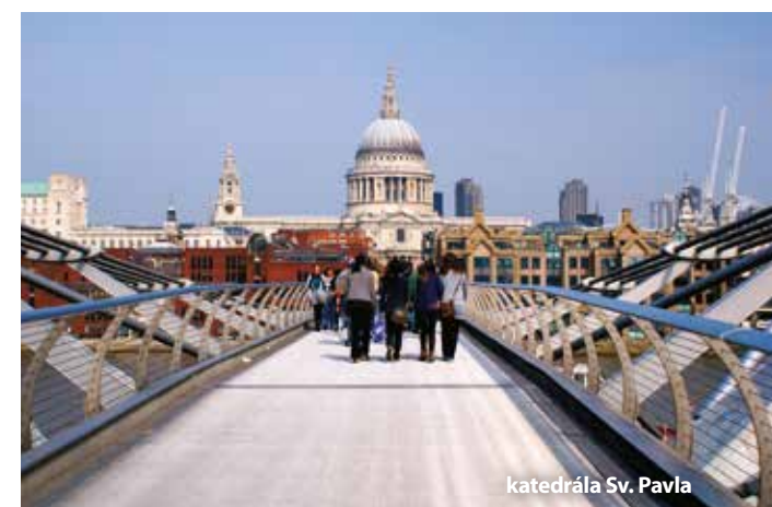
katedrála Sv. Pavla