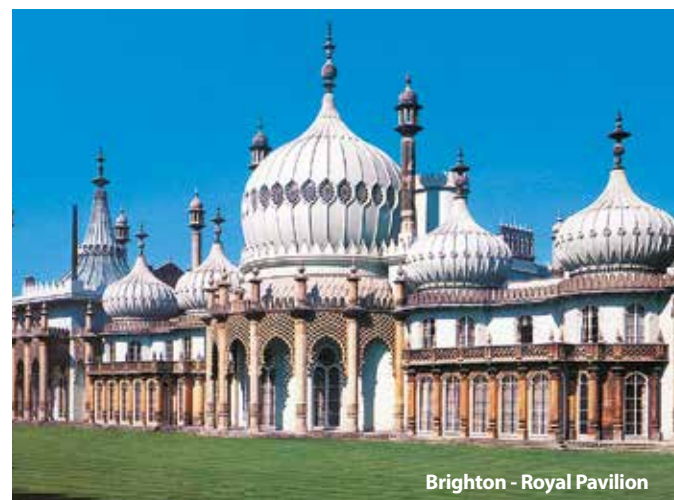
Brighton - Royal Pavilion