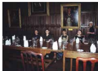
Anglie - Oxford (Harry Potter)