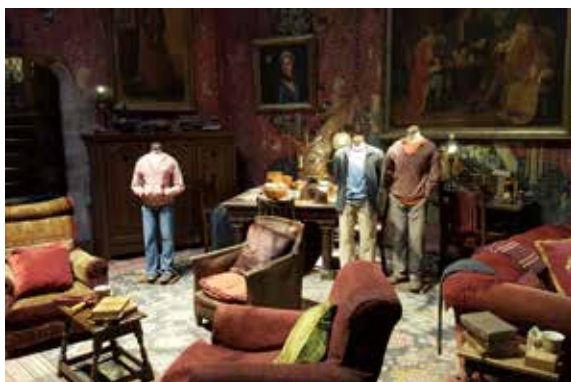
Filmové ateliéry Londýn - Warner Bros. Studio