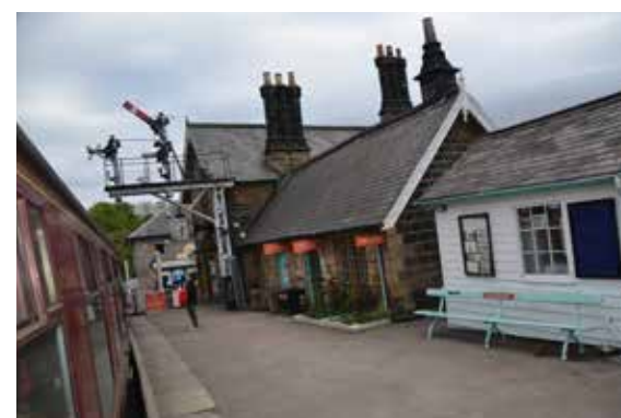
Nadraží v Bradavicích