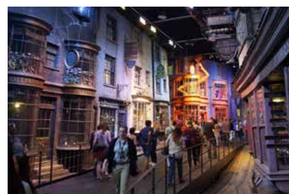
Filmové ateliéry Londýn - Warner Bros. Studio

Zařadte do programu místa, kde se natáčely filmy o Harry Potterovi a studenti budou nadšeni.