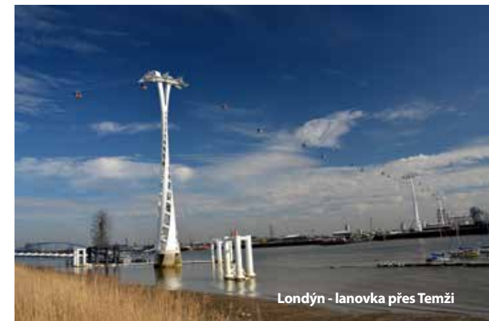
Londýn - lanovka přes Temži