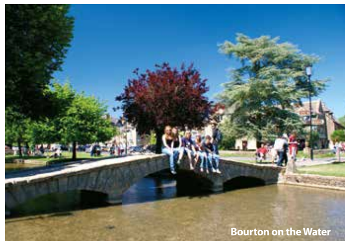
Bourton on the Water

Nenašli jste, co jste hledali? Nevadí, uděláme Vám program na míru.