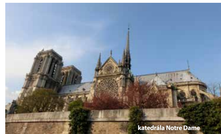
katedrála Notre Dame