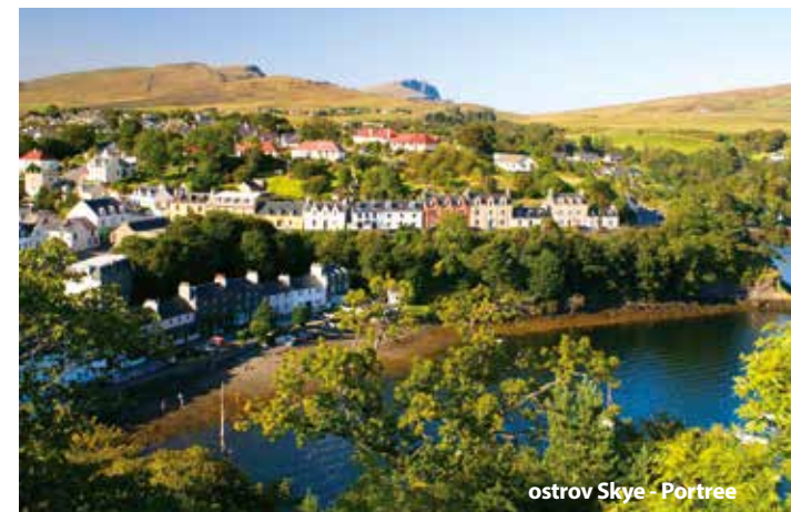
ostrov Skye - Portree