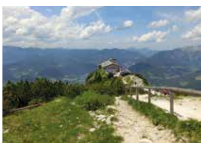
Německo - Berchtesgaden - Orlí hnízdo