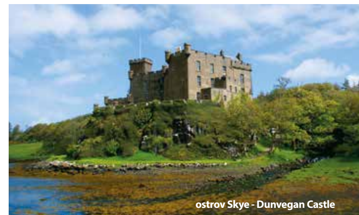
ostrov Skye - Dunvegan Castle