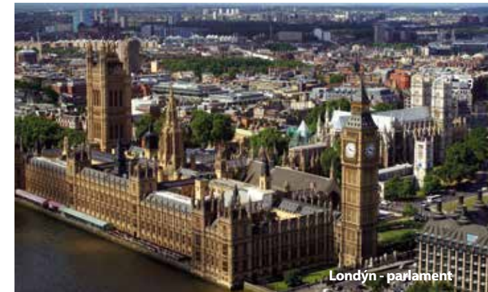
Londýn - parlament