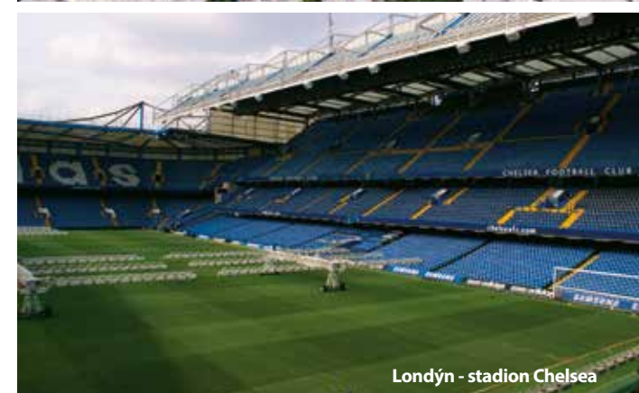
Londýn - stadion Chelsea