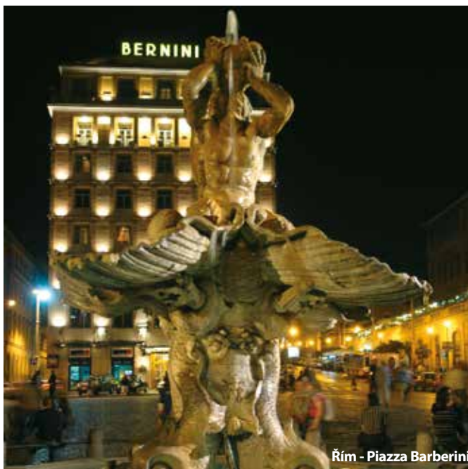
Řím - Piazza Barberini