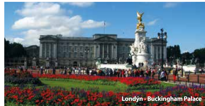
Londýn - Buckingham Palace