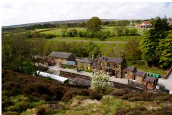
Nadraží v Bradavicích