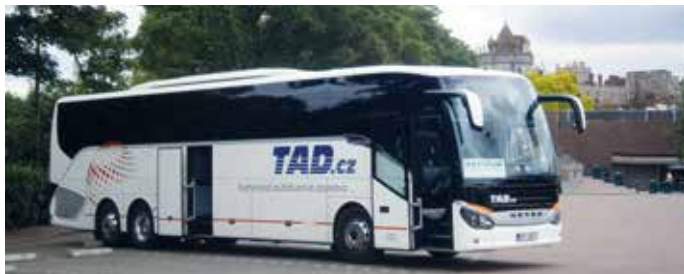
Setra 57 míst, rok výroby 2014

Na našich zájezdech se setkáte s těmito busy: