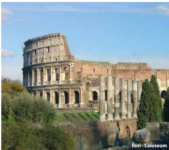
Řím - Coloseum