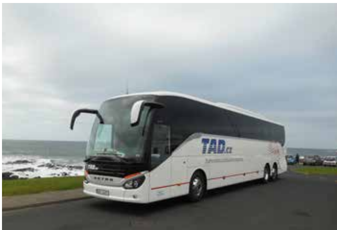
Setra 517 HD - 57 míst - rok výroby 2015