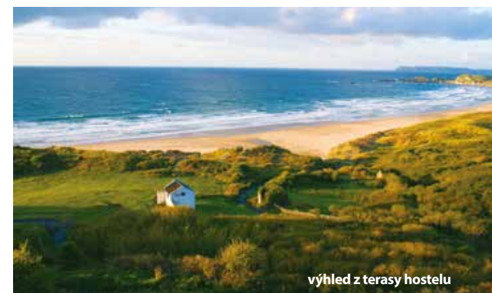
výhled z terasy hostelu