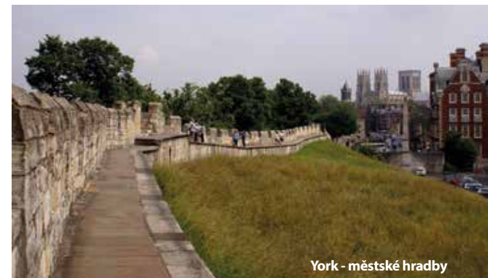
York - městské hradby