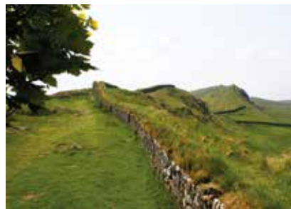
Skotsko / Anglie - Hadriánův val