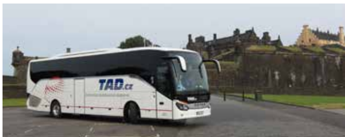
Setra 49 míst, rok výroby 2014

Jste neúplná skupina? Nenaplníte celý autobus?