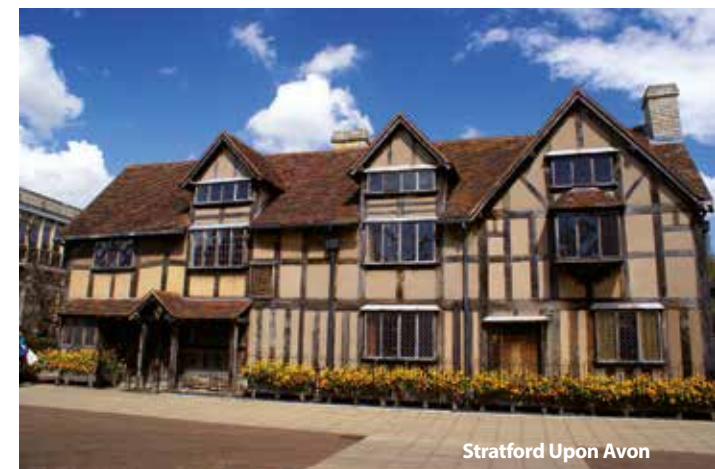
Stratford Upon Avon