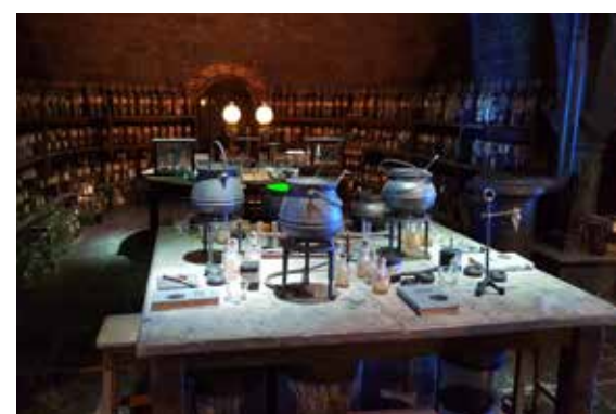
Filmové ateliéry Londýn - Warner Bros. Studio