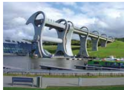
Skotsko - Falkirk Wheel