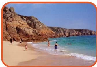
Cornwall - pláž u Porthcurno