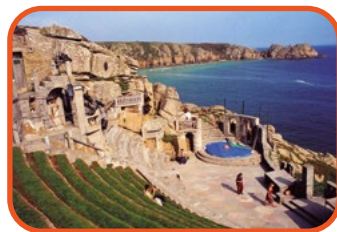
Cornwall - Minack Theatre