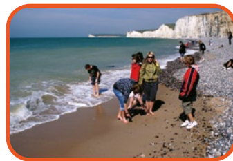
Křídové útesy - Eastbourne