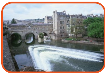
Bath - Pulteney Bridge