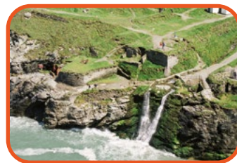
Cornwall - Tintagel