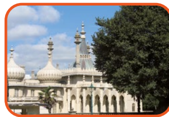
Brighton - Královský pavilón