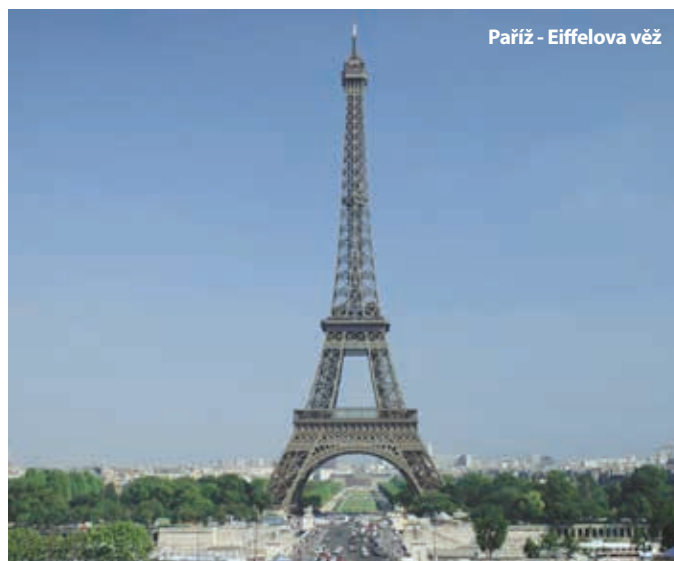
Paříž - Eiffelova věž

Cena zájezdu je kalkulovaná pro 45 osob + 3x pedagogický dozor. Sleva až 500 Kč / osoba, viz katalog strana 54.