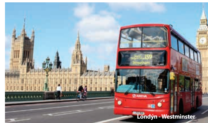
Londýn - Westminster