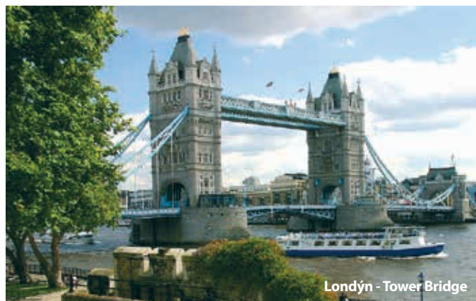
Londýn - Tower Bridge

Získejte slevu až 500 Kč výběrem termínu od listopadu 2019 do března 2020