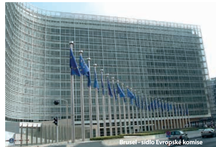
Brusel - sídlo Evropské komise