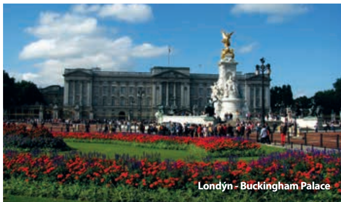
Londýn - Buckingham Palace

Cena zájezdu je kalkulovaná pro 45 osob + 3x pedagogický dozor. Sleva až 500 Kč / osoba, viz katalog strana 54.