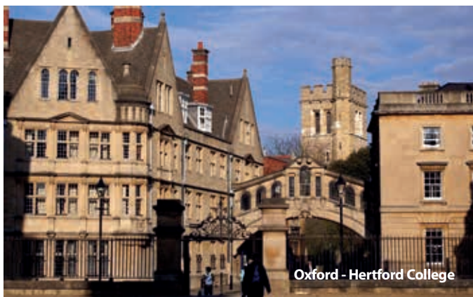
Oxford - Hertford College