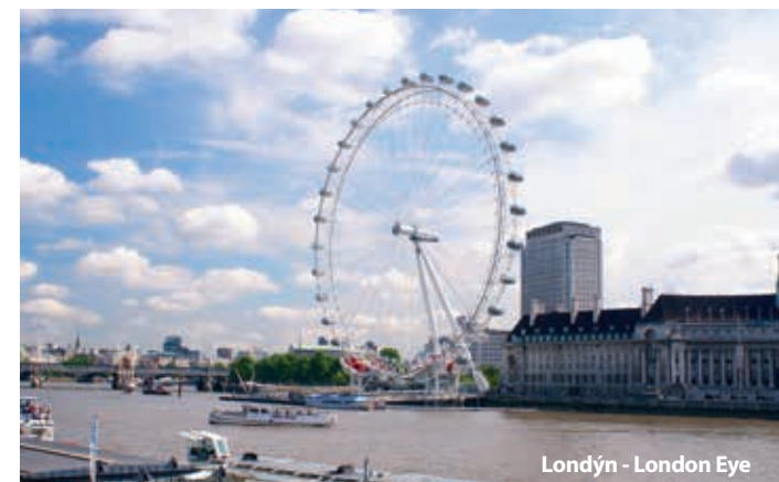
Londýn - London Eye