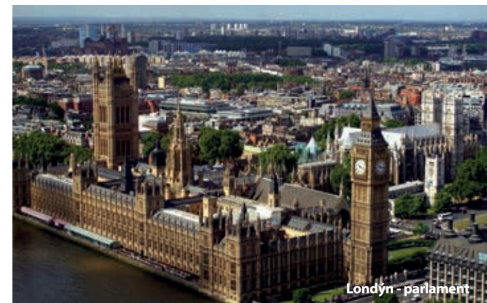
Londýn - parlament