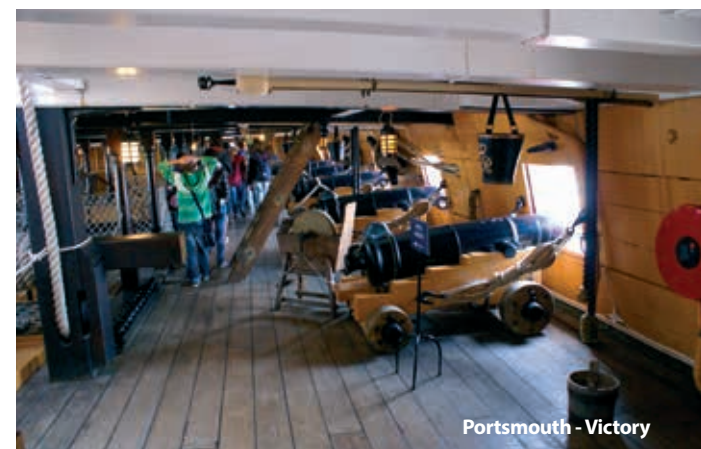
Portsmouth - Victory