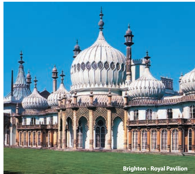
Brighton - Royal Pavilion