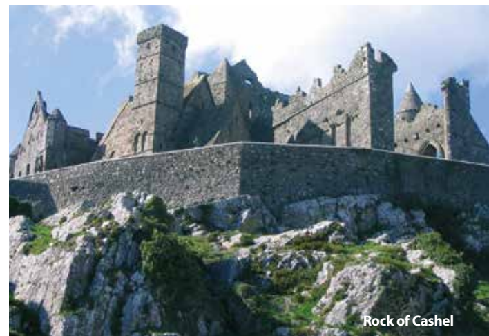
Rock of Cashel

Cena zájezdu je kalkulovaná pro 45 osob + 3x pedagogický dozor. Sleva 50 Kč až 300 Kč / osoba, viz katalog strana 52.